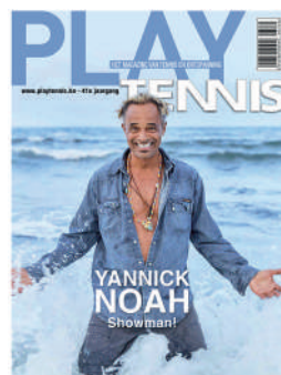
TRIMESTRIEL FR 4,50€