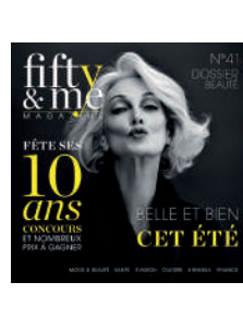
TRIMESTRIEL FR 4,50€