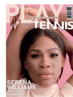
TRIMESTRIEL NL 4,50€