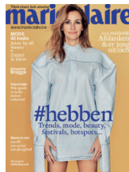
MENSUEL NL 4,50€