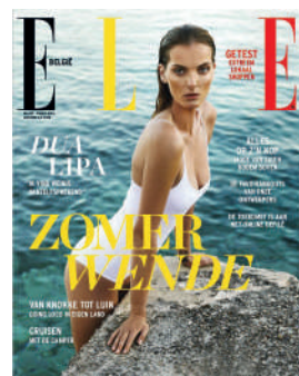
MENSUEL NL 4,50€