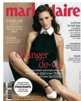
MENSUEL FR 4,50€