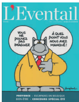
MENSUEL FR 6€