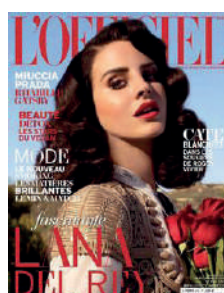
BIMESTRIEL FR 3€