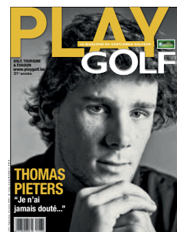
TRIMESTRIEL FR 4,50€