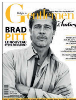
TRIMESTRIEL FR 6€