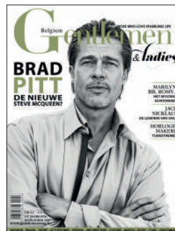
TRIMESTRIEL NL 6€