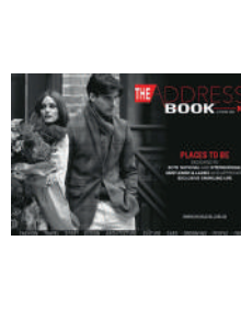
ANNUEL FR/NL 20€