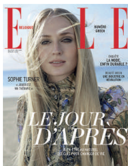
MENSUEL FR 4,50€