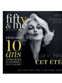
TRIMESTRIEL FR 4,50€