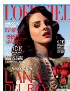
BIMESTRIEL FR 3€