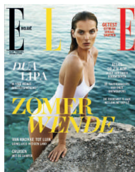
MENSUEL NL 4,50€