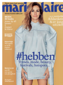
MENSUEL NL 4,50€