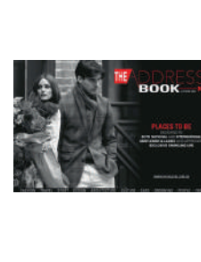
ANNUEL FR/NL 20€