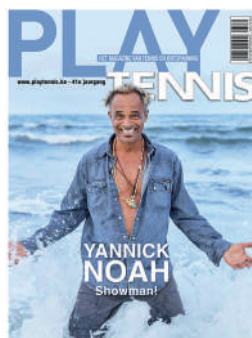
TRIMESTRIEL FR 4,50€