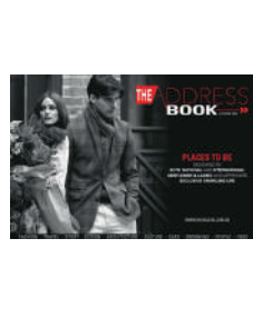
ANNUEL FR/NL 20€