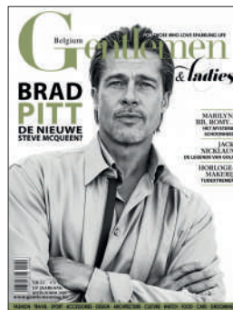
TRIMESTRIEL NL 6€