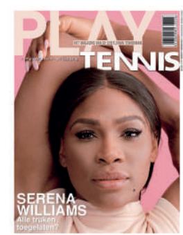
TRIMESTRIEL NL 4,50€