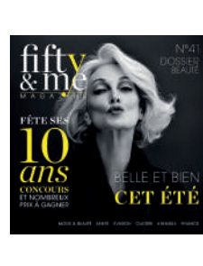
TRIMESTRIEL FR 4,50€