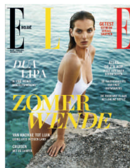
MENSUEL NL 4,50€