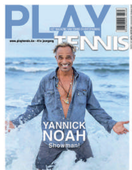
TRIMESTRIEL FR 4,50€