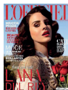
BIMESTRIEL FR 3€