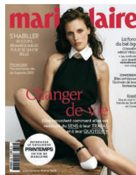
MENSUEL FR 4,50€