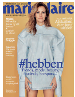
MENSUEL NL 4,50€