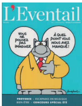
MENSUEL FR 6€